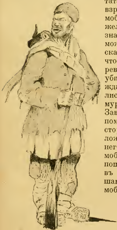
Израевской волости — помощникъ

— «Не надо, бачка, не надо, моя не надо,» кричалъ онъ,