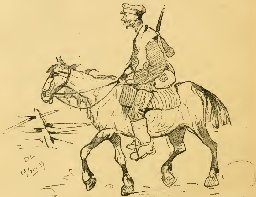
Конный развѣдчик — Мих. полкѣ.

Характерно то, что союзническія военныя части и высокіе комиссары вѣдь видѣли и знали все это, имъ была открыта истинная картина и до мелочей было знакомо положеніе дѣла: и предательство на фронтѣ, и безконечный грабежъ союзника-Россіи, и вмѣшательство въ государственныя дѣла, и угрозы самой возможности дальнѣйшей борьбы отъ присутствія въ тылу этой многотысячной разнузданной, вооруженной массы.