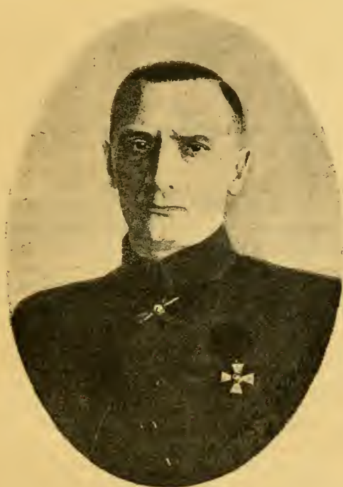
Верховный Правитель и Верховный Главнокомандующій, Адмиралъ Александръ Васильевичъ Колчакъ.

18 Ноября 1918 года адмиралъ Колчакъ былъ поставленъ передъ совершившимся фактомъ. Онъ подчинился ему и принялъ на себя всю полноту Верховной власти.